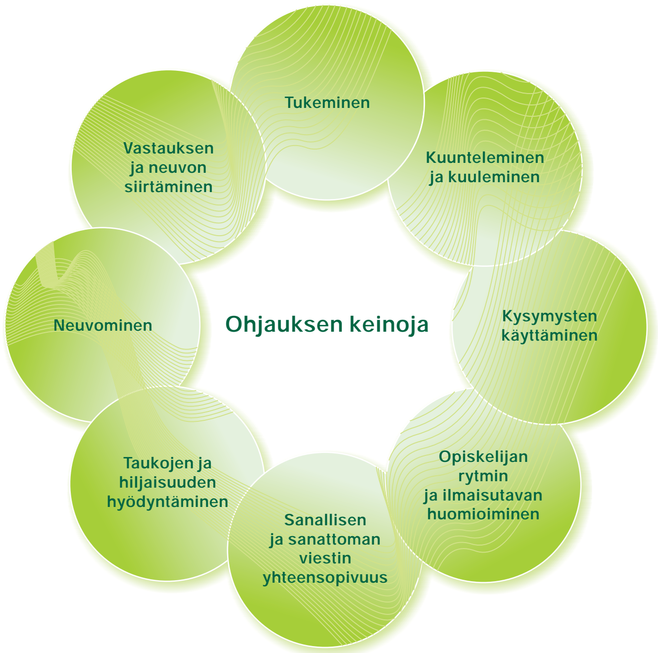
Kuvio 3. Ohjauksen keinoja Mukailten Mykrää (2007).

Työpaikkaohjaaja voi käyttää erilaisia keinoja opiskelijan oppimisen edistämisen tueksi. Ohjauksen keinot ovat yleisiä vuorovaikutukseen liittyviä asioita ja sopivat erilaisiin ohjaustilanteisiin ja ohjauskeskusteluihin. Ohjauksen keinoja esitellään seuraavassa kuviossa.