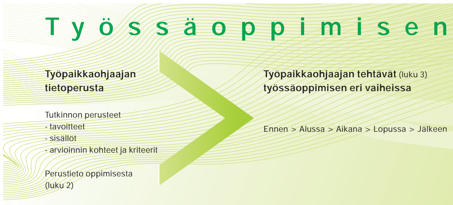
Kuvio 1. Työssäoppimisen ohjaamisen kokonaisuus.